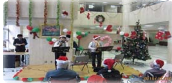
オカリナ愛好会田沼の方々