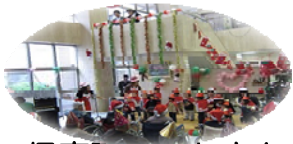
保育所のみなさん